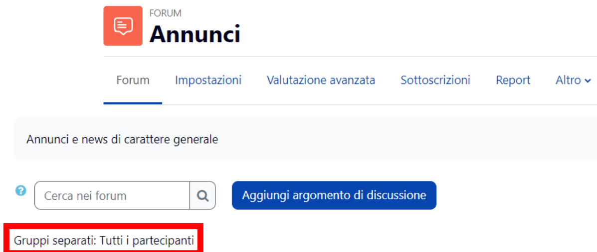
Figura 4 - Un forum Annunci in modalità Gruppi separati

La modalità gruppo assegnata sarà visualizzata nelle impostazioni della singola attività (Figura 4) ad esempio: